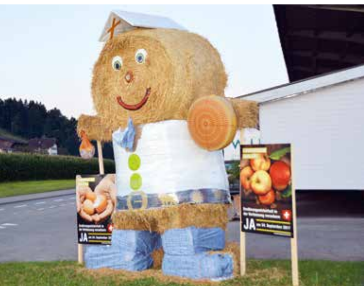
Une des nombreuses créations paysagères que les familles paysannes ont mises en place dans toute la Suisse.

La communication de base « Proches de chez. Les paysans suisses. » a lancé une série d'affiches présentant les animaux de la ferme en chemise edelweiss. Dans le même temps, les travaux de révision de la stratégie et d'une nouvelle image pour 2018 ont commencé. Le concours photo agrimage.ch a duré jusqu'à l'été. Plus de 1600 photographes dévoués ont soumis quelque 15000 images dans neuf catégories en rapport avec l'agriculture suisse. La cérémonie de remise des prix a eu lieu à l'OLMA à Saint-Gall. Les meilleures images ont été présentées par la même occasion sous la forme d'une exposition itinérante. Toujours à l'OLMA, la nouvelle exposition sur la pomme de terre de l'USP s'est tenue pour la première fois dans le cadre du concept « Erlebnis Nahrung ». Au total, les modules pour le stand de la communication de base ont paru dans 30 salons et expositions. Un nouveau court-métrage a été ajouté à la chaîne de télévision Internet www.buuretv.ch , la page Facebook a attiré plus de 700 nouveaux fans (14400 au total) et 1575 fermes et leurs offres figurent désormais sur le portail de la vente directe a-la-ferme.ch . Le Brunch du 1 er août a eu lieu pour la 25 e fois. Un brunch VIP spécial s'est tenu pour l'occasion