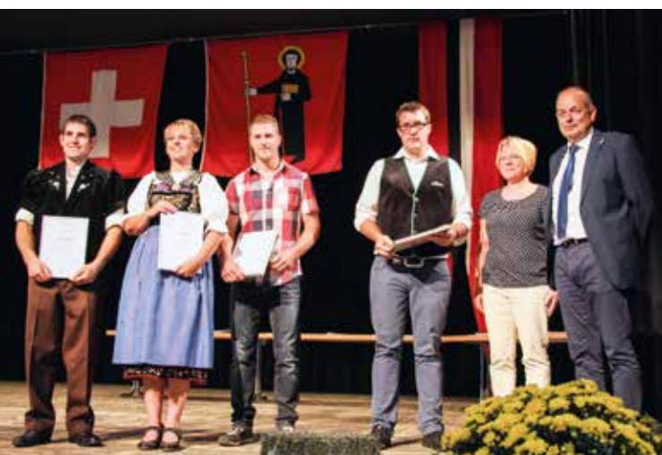
Lors de la remise des diplômes de maîtrise de la volée 2017, les médias agricoles ont remis un prix aux apprentis ayant le mieux réussi les examens.

La mise à disposition de données statistiques sur l'agriculture selon l'accord avec les offices fédéraux de la statistique et de l'agriculture a constitué la principale activité d'Agristat. À la fin de l'année, les préparations pour la révision de l'indice des prix d'achat de moyens de production agricole ont été décidées. Un sondage a été effectué auprès des abattoirs de volaille pour actualiser les facteurs pris en compte dans le calcul de la production. Comme d'habitude, Agristat a publié trois documents: « AGRISTAT – Cahier statistique mensuel », « Statistiques et évaluations » et « Statistique laitière de la Suisse ». Des informations et des graphiques publiés sur le site Internet de l'USP viennent compléter l'offre de ces parutions. Agristat a de nouveau encadré différents projets de banques de données, comme celles d'Agriprof, d'Agora et de Proviande.