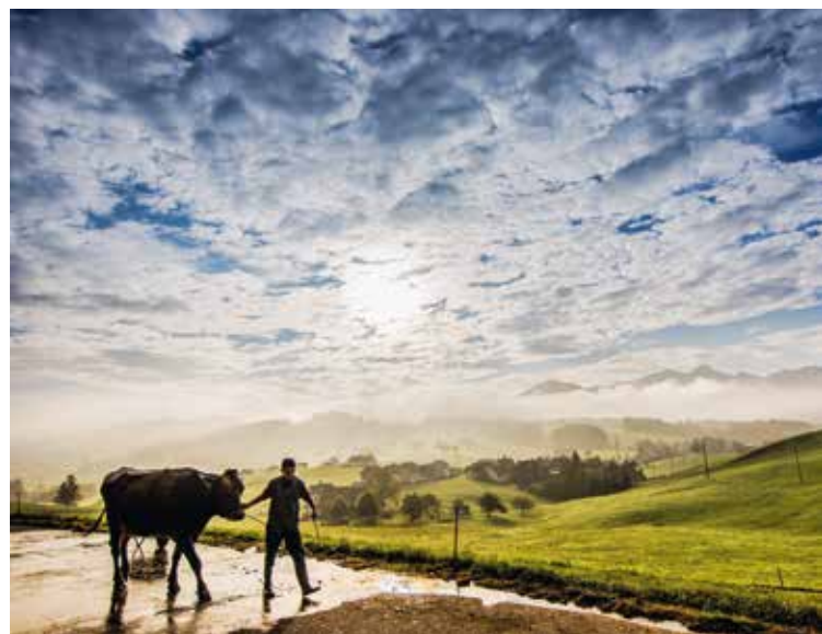
L'image gagnante du concours Agrimage de « Proches de vous. Les paysans suisses. ».

La division Administration & Immeubles est responsable de l'accueil, du service de maison et de la gérance d'immeubles répartis sur huit sites en Suisse alémanique de diverses sociétés et fondations. L'année 2017 a également vu l'exécution de divers travaux de réparation et d'entretien. La direction de l'Office de constructions agricoles, avec ses quatre sites à Trimmis, Weinfelden, Küssnacht et Heiligenschwendi, est aussi rattachée à cette division. Son conseil d'administration a décidé de transférer en 2018 le site de Heiligenschwendi au Berner Bauern Verband à Ostermundigen.