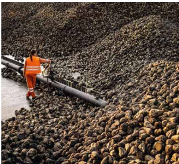
Après deux années plutôt moroses, la récolte de betteraves sucrières est jugée bonne.

Le gel inhabituel du mois d'avril a frappé de nombreuses cultures fruitières et de baies déjà en fleurs ou portant de petits fruits. Les dommages ont varié selon les exploitations et les cultures. Les quantités récoltées sont dans tous les cas restées faibles: alors que la moitié de la récolte des cerises et des abricots a été compromise, les pruneaux n'ont atteint que les deux tiers de la quantité normale, les pommes et les poires environ 75%, les fraises et les myrtilles à peu près 80%. Après une bonne croissance au printemps, le gel a