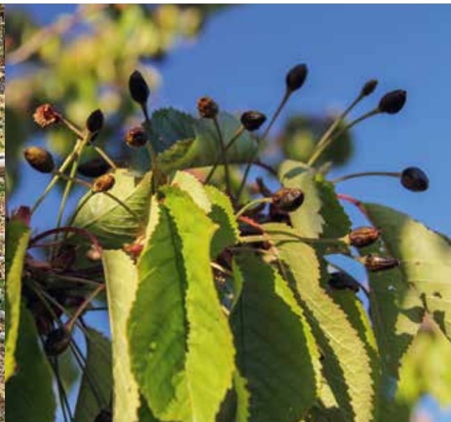
Le gel tardif d'avril a causé de gros dégâts aux vignes et aux cerises.