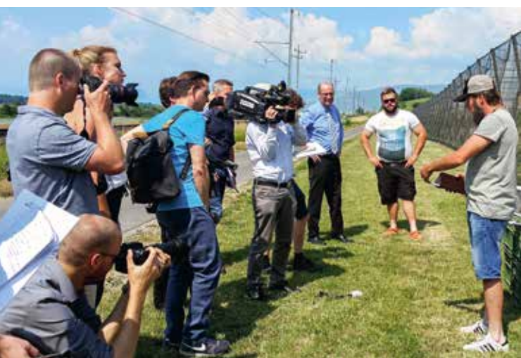
Lors de la rencontre avec les médias dans le Seeland, l'USP et des agriculteurs ont donné des informations sur la protection phytosanitaire et les soins prophylactiques.

Dans le cadre du bétail de boucherie, l'USP s'est engagée pour des conditions de marché favorables, telles que des importations réglementaires, des usages commerciaux avantageux pour les producteurs et une promotion efficace des ventes au travers de Proviande. Pour ce qui est de la viande bovine, la situation était positive jusqu'en automne. Par contre, le marché des porcs est resté source d'inquiétude.